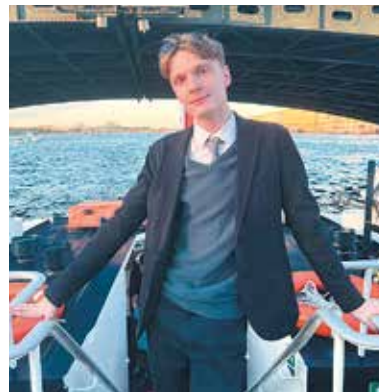
Любимый Дедушка Мороз!

Я очень хочу в новом году учиться в новом красивом и удобном корпусе Института медицинского образования. Мне будут завидовать все студенты Санкт-Петербурга и даже страны! Обещаю хорошо себя вести!