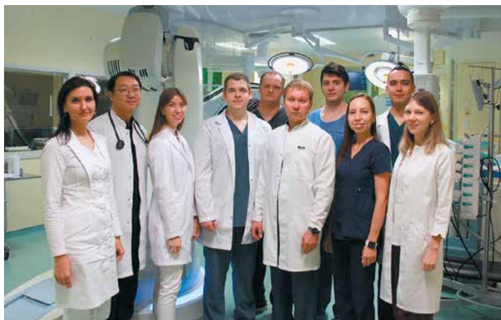
Коллектив Клиники сосудистой хирургии

вание внутрисосудистого ультразвукового исследования, углекислого газа в качестве контрастного вещества, трехмерных моделей аорты пациента, напечатанных на 3D-принтере, позволяют выполнять операции у коморбидных и пожилых пациентов. А появление новых браншированных и фенестрированных стент-графтов привело к настоящей революции аортальной хирургии в Центре и в России в целом: стало возможным выполнять малоинвазивные операции у пациентов