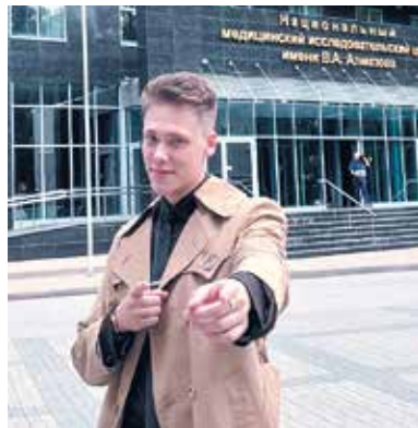
Многоуважаемый Дедушка Мороз!

Хочу любезно у тебя попросить, чтобы в новом 2025 году большинство лекций в нашем Институте стали дистанционными, чтобы их было удобно слушать не только в лекционном зале, но и в комфортной домашней обстановке. (И ни в коем случае не игнорировать их наличие, конечно же!)