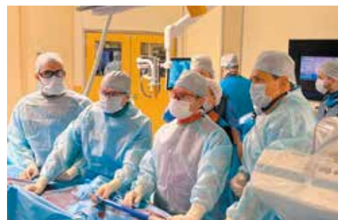
Команда сосудистых хирургов Центра Алмазова за работой в операционной

Коллектив Клиники сосудистой хирургии от всей души поздравляет читателей с Новым 2025 годом и желает крепкого здоровья вам и вашим семьям!