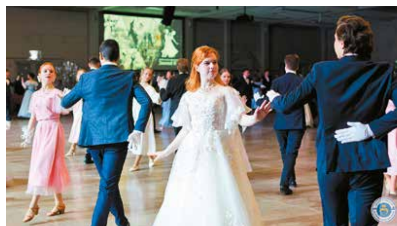
75 очаровательных пар закружились в танце в зале «Алмазов»

В завершение церемонии состоялось награждение дипло-