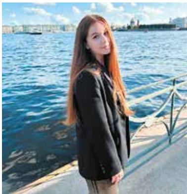
Дорогой Дедушка Мороз!

Больше всего в новом году я бы хотела выступить на научной конференции, например, поучаствовать в АММФ 2025 в качестве докладчика, проявить себя и достойно представить Центр Алмазова.