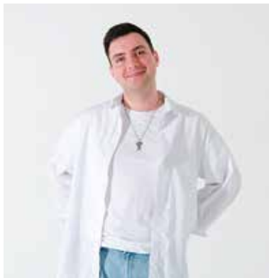
Уважаемый Дедушка Мороз!

Так как я уже на 5 курсе, то очень хочу попросить тебя в новом 2025 году помочь мне сдать без проблем все экзамены, спокойно подготовиться к государственной аттестации и защите научной работы, чтобы я наконец-то получил заветный диплом и стал врачом, окончившим лечебный факультет Центра Алмазова.