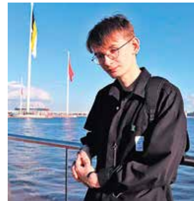
Глубокоуважаемый Дед Мороз!

В этом году я был очень хорошим мальчиком, много учился и работал, поэтому больше всего я мечтаю о здоровом сне. Хочу нормально выспаться, уснуть до темноты и проснуться в лучах солнца. Спасибо тебе заранее!