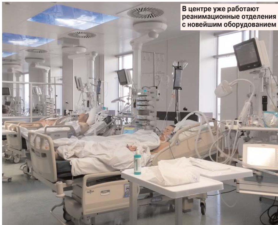
В центре уже работают реанимационные отделения с новейшим оборудованием

Заканчивается строительство детско-реабилитационного центра. Начато воз-