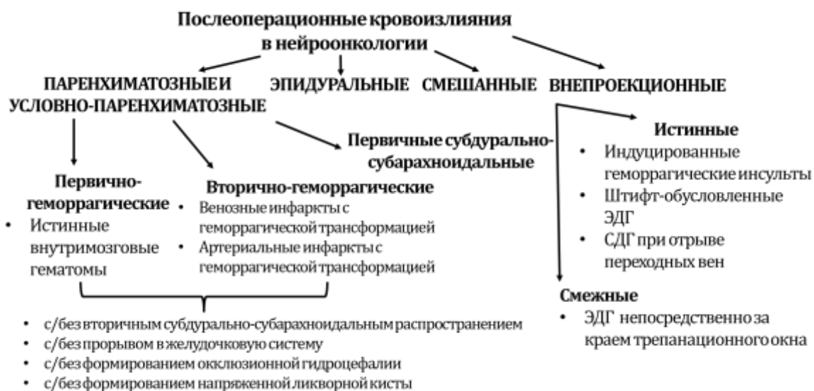
Рисунок 1 – Типы послеоперационных геморрагических осложнений в нейроонкологии по локализационному признаку

На основе данных о механизмах развития кровоизлияний, а также с учетом локализационного признака и хирургических аспектов нами предложена топографо-анатомическая классификация послеоперационных кровоизлияний в нейроонкологии (Рисунок 1).