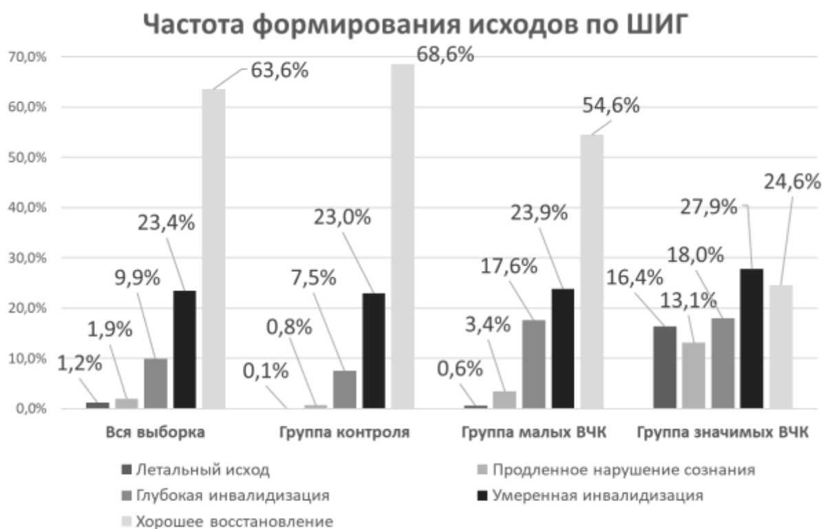
Рисунок 3 – Частота формирования исходов по шкале исходов Глазго среди исследуемых групп пациентов ( p < 0,001 )

Диаграмма исходов лечения наглядно отражает неудовлетворительные результаты повторных хирургических вмешательств (Рисунок 3). Корреляционный анализ между рядом исследованных клинических параметров и исходами лечения не позволил выявить предикторы лучшего прогноза при формировании ПГО.